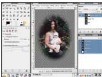
Winieta 2. Wygląd poszczególnych warstw tworzących obraz patrząc „od dołu”: warstwa Tło, warstwa Kopia:Tło, warstwa Kopia:Kopia:Tło

zmodyfikowana warstwa trzecia przykryła rozmyta warstwę drugą.