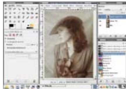
Winieta 3. Krok 1. Otwarte zdjęcie, w panelu Warstwy widoczne duplikaty warstwy Tła.

Opisane powyżej sposoby tworzenia winiet mogą stanowić punkt wyjścia do własnych modyfikacji obrazu. Winiety mogą stanowić na przykład motywy roślinne, kwiatowe lub każde inne. Wtedy to obraz