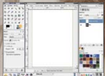
Winieta 1. Krok 1. Tworzenie nowej warstwy w kolorze białym.

Przyjrzyjmy się jak wygląda proces cyfrowego tworzenia takiego obrazu.