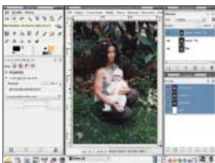
Winieta 2, Kroki 3 i 4. Warstwa Kopia:Kopia:Tło jest ponownie widoczna i aktywna. Zaznaczymy obszar wokół postaci i wybieramy polecenie Warstwa->Dodaj maskę warstwy z atrybutem Zaznaczenie . Na ekranie wokół postaci pojawia się rozmyta winieta.

Teraz musimy ponownie uczynić widoczną i uaktywnić najwyższą warstwę. Klikamy w miejsce, w którym powinna znaleźć się ikona z okiem i drugi raz w ikonę warstwy. Warstwa staje się widoczna i aktywna co rozpoznajemy po tym, że znikło rozmycie obrazu. Oczywiście nic nie znikło, tylko ostra nie-