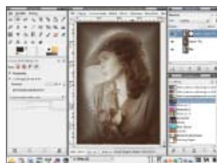
Winieta 3, Warstwa Kopia:Kopia:Tło – tworzenie zaznaczenia wokół postaci oraz maski warstwy analogicznie jak w Winiecie 2.

z takim motywem należy umieścić w warstwie drugiej zamiast pierwszej kopii modyfikowanego zdjęcia.