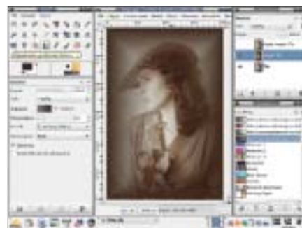
Winieta 3, Krok 2. Warstwa Kopia:Tło wypełniona gradientem – widoczne przyciemnienie od centrum do brzegów kadru.