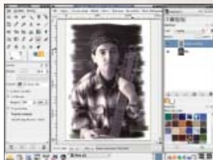
Winieta 1. Kroki 2, 3. Wycieranie winiety w górnej warstwie przy użyciu narzędzia Gumka (narzędzie to posiada identyczne atrybuty jak narzędzie Pędzel stąd w panelu atrybutów widnieje nazwa Pędzel)