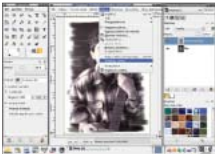
Winieta 1. Krok 4. Spłaszczenie obrazu przy użyciu polecenia Obraz->Spłaszcz obraz przed zapisaniem do pliku.