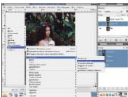
Winieta 2. Krok 2. Warstwa Kopia:Kopia:Tło jest niewidoczna (brak ikony z okiem). Wybierając polecenie Filtry->Rozmycie->Rozmycie gaussa rozmywamy obraz warstwy Kopia:Tło