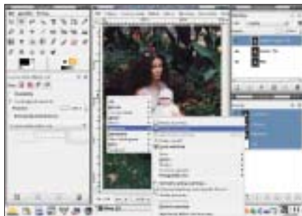
Winieta 2. Krok 1. Tworzenie duplikatów warstwy Tła. Polecenie Warstwa -> Duplikuj warstwę .