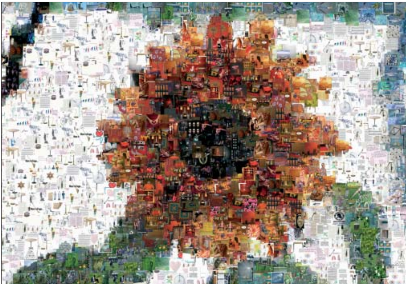
Rysunek 3: Zdjęcia składowe w kolażu nachodzą na siebie.