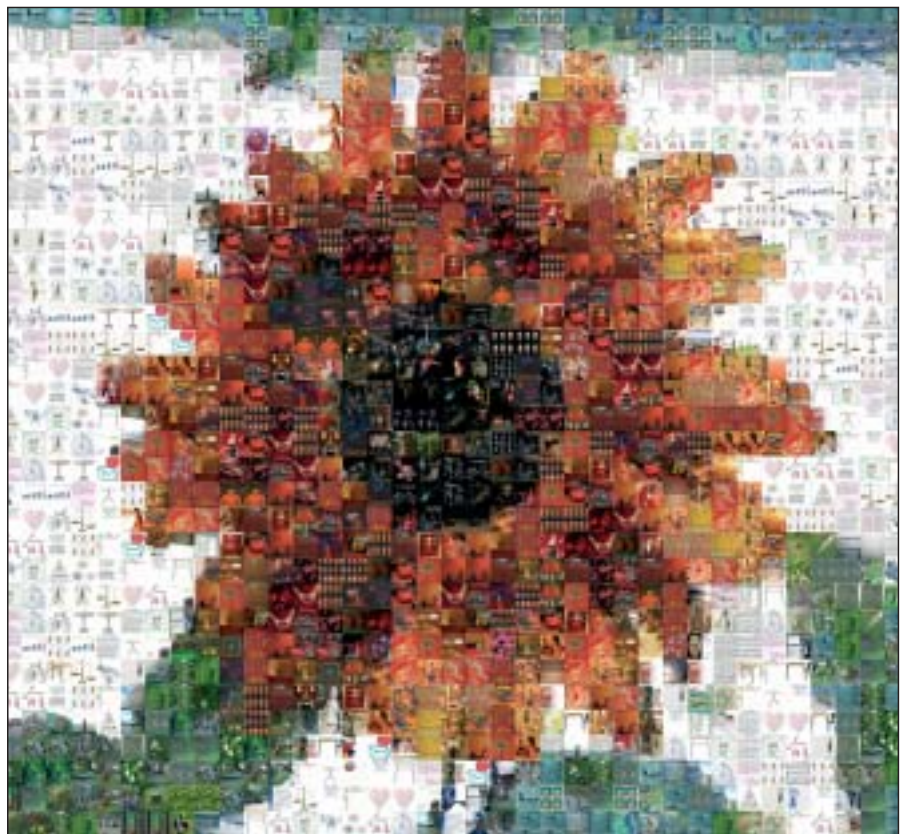
Rysunek 2: Lepsza fotomozaika: więcej jest kostek i daje się odczytać więcej szczegółów.

Wymiary obrazu docelowego dobieramy pod kątem produktu finalnego. Drukowane mozaiki wyglądają dobrze dopiero w dużych formatach. To zaś oznacza, że zdjęcie w postaci komputerowej musi być odpowiednich wymiarów. Na przykład, jeśli chcemy utworzyć mozaikę w formacie DIN A3 (a to wcale nie jest jeszcze duży format), zdjęcie-szablon musi mierzyć przynajmniej 4000 na 6000 pikseli. Może zająć konieczność przeskalowania pliku graficznego w programie Gimp. W przypadku takich wymiarów mozaika będzie miała szerokość 33 kostek. Na Rysunku 2 pokazano ładniejszą mozaikę zbudowaną z większego szablonu.