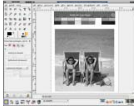
Rysunek 1: Pierwszy sposób zamiany obrazu kolorowego na czarno-biały. Zmiana trybu RGB na tryb Skali szarości – następuje utrata informacji o kolorze. Polecenie Obraz | Tryb | Odcienie szarości . Obrazek przed i po operacji.