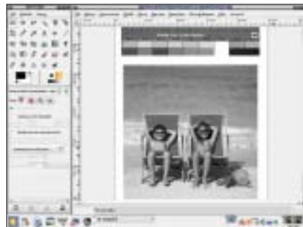
Rysunek 2: Drugi sposób to zamiana obrazu kolorowego na czarno-biały. Desaturacja – obrazek zachowuje tryb RGB. Polecenie Warstwa | Kolory | Desaturacja . Obrazek przed i po operacji.

pozbawiamy się w istocie możliwości wpływu na jego końcowy wygląd – odwzorowanie barw w skali szarości, tonalność, kontrast itp.