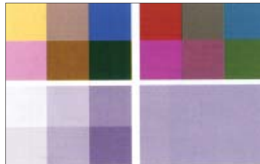
Rysunek 5: Niektóre kolory po zamianie na skalę szarości mogą posiadać taki sam walor, a więc zleją się w jednolitą płaszczyznę.

W skrajnych przypadkach możemy również otrzymać obraz przypominający swym