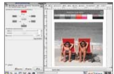
Rysunek : Trzeci sposób zamiany obrazu kolorowego na czarno-biały. Modyfikacja odcienia jasności i nasycenia. Obrazek zachowuje tryb RGB. Polecenie Narzędzia | Narzędzia kolorów | Odcień i nasycenie . Wygląd przed i po operacji; na trzeciej ilustracji zachowano w obrazie jeden kolor – czerwony.