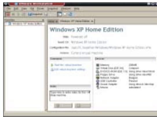
Rysunek 3: Użytkownik postanowił zainstalować Windows XP na wirtualnym komputerze.

Skrypt zadaje następnie pytanie o to, czy dla systemu-gościa ma być dostępne połączenie sieciowe z samym systemem-hostem ( Do you want to be able to use host-only networking in your virtual machines? ). Połączenie takie umożliwia korzystanie w emulowanym pececie z zasobów systemu-hosta. Emulowany komputer może też korzystać z połączenia internetowego hosta w trybie tłumaczenia adresów (NAT) lub przez emulowany most sieciowy ( bridge mode ). W tym ostatnim przypadku emulowany komputer