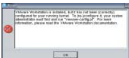
Rysunek 1: Taki komunikat pojawia się wtedy, gdy próbujemy uruchomić VMware bez skonfigurowania oprogramowania po zakończeniu instalacji.

Jak wspomnieliśmy, licencja na oprogramowanie VMware nie jest tania. Można