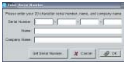
Rysunek 4: Wirtualną maszynę można uruchomić dopiero po podaniu poprawnego numeru seryjnego. Numer ten otrzymujemy albo wraz z licencją, albo po zgłoszeniu chęci wypróbowania oprogramowania przez 30 dni.

Zanim system zostanie uruchomiony, użytkownik niezarejestrowanej wersji