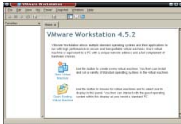
Rysunek 2: Po pierwszym uruchomieniu oprogramowanie VMware wymaga skonfigurowania. Możemy albo utworzyć nową wirtualną maszynę, albo załadować istniejącą konfigurację.