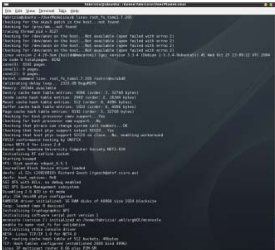
Rysunek 3: Uruchamianie wirtualnej maszyny UML.