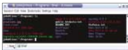
Rysunek 1: Większość dystrybucji zawiera domyślnie kolorowe wyjście polecenia ls.

DIR i LINK są katalogami i symbolicznymi dowiązaniem do innych plików