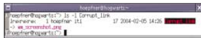
Rysunek 3: Pokolorowane wyjście ls z definicją koloru tła.

TERM linux #... TERM Eterm NORMAL 00 # domyślne ustawienie FILE 00 # domyślne ustawienie dla plików DIR 01;34 # domyślne ustawienie dla katalogów LINK 01;36 # dowiązania symboliczne #... ORPHAN 40;31;01 # niepoprawne dowiązania > symboliczne #... EXEC 01;32 # pliki wykonywalne .tar 01;31 # pliki z rozszerzeniem.tar .jpg 01;35 [...]