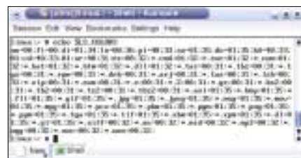
Rysunek 2: Domyślne wartości LS_COLORS.